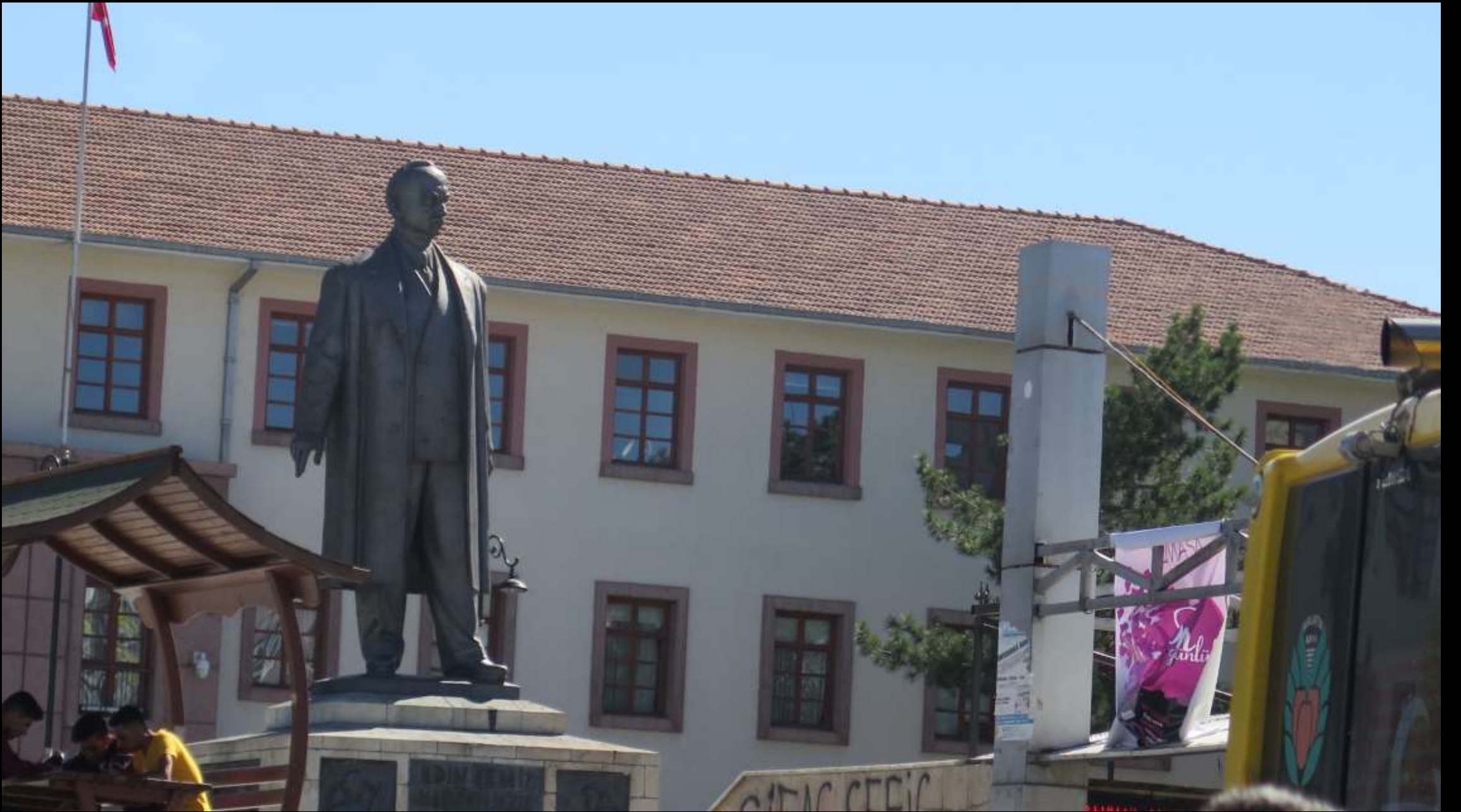
Malatya ile özdeşleşmiş bir isim: İsmet İnönü