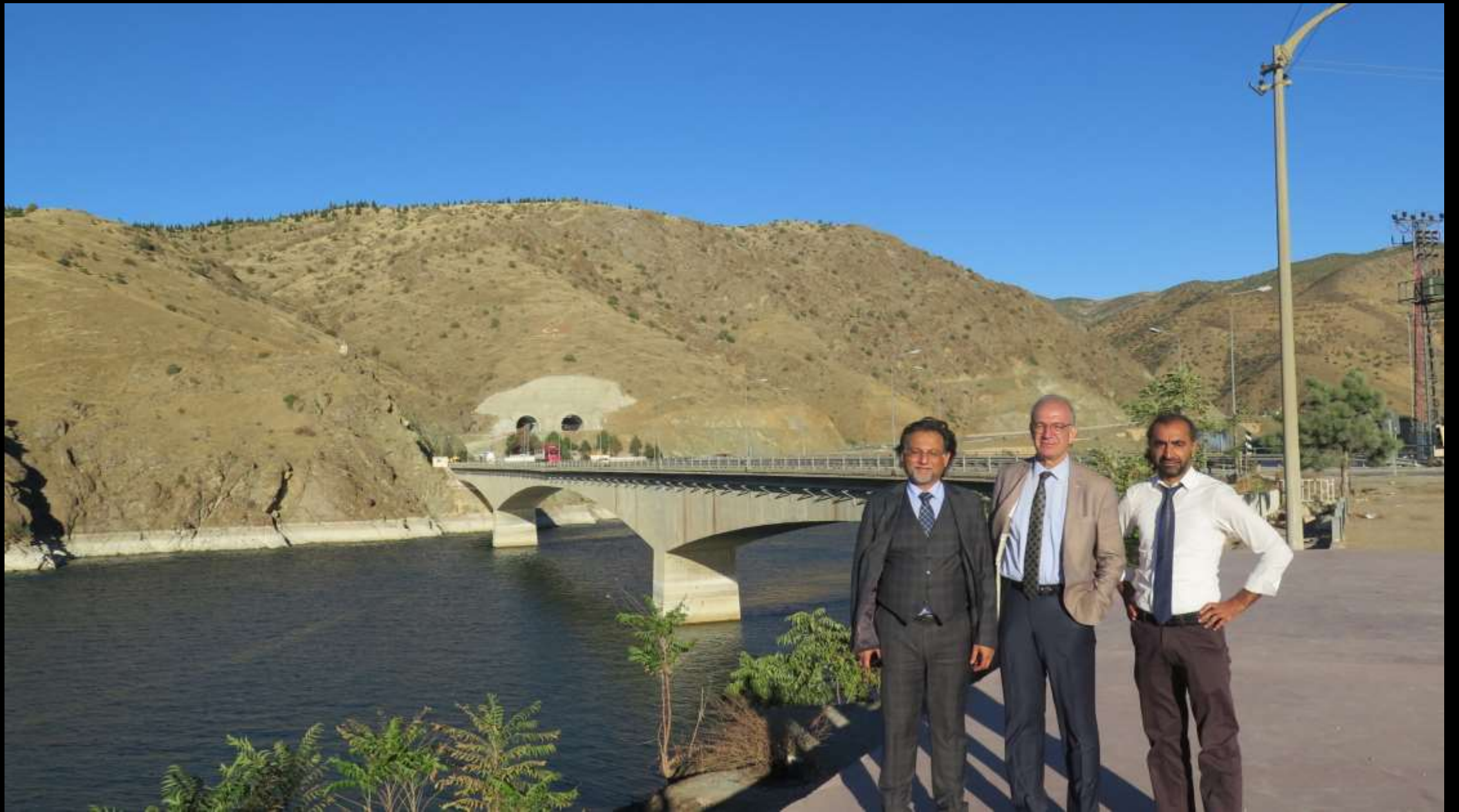
K m rhan k pr s   n nde hatıra fotođrafı...