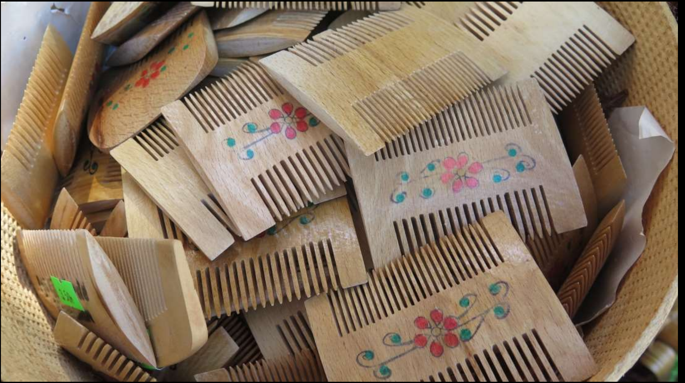
Babaannemin 'sirke tarađını' hatırladım.