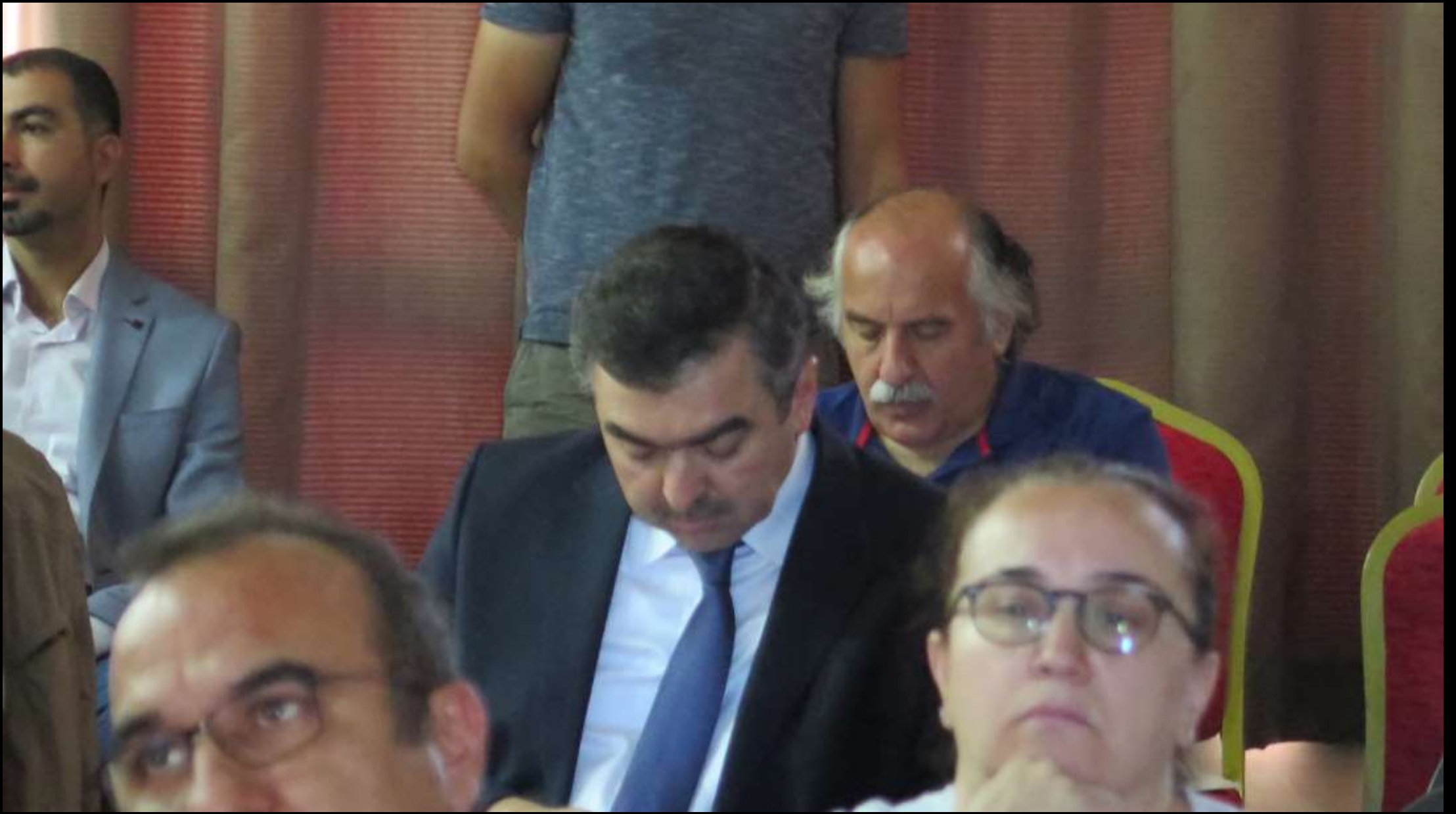
Sempozyum programını inceliyorlar.