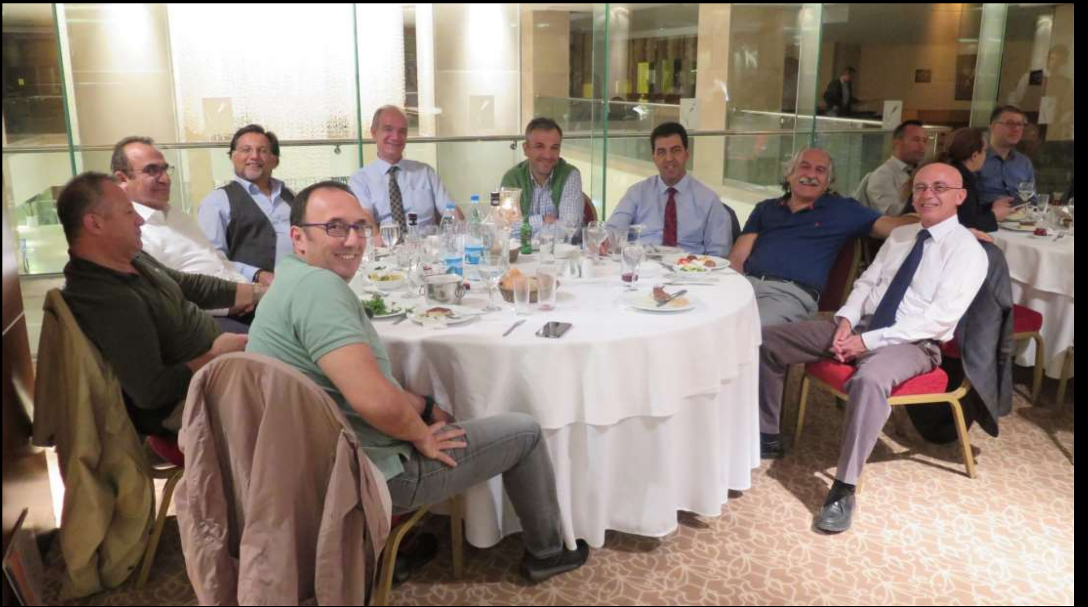
Yaşlılar kulübü: «Gözümüz arkada kalmayacak!...»