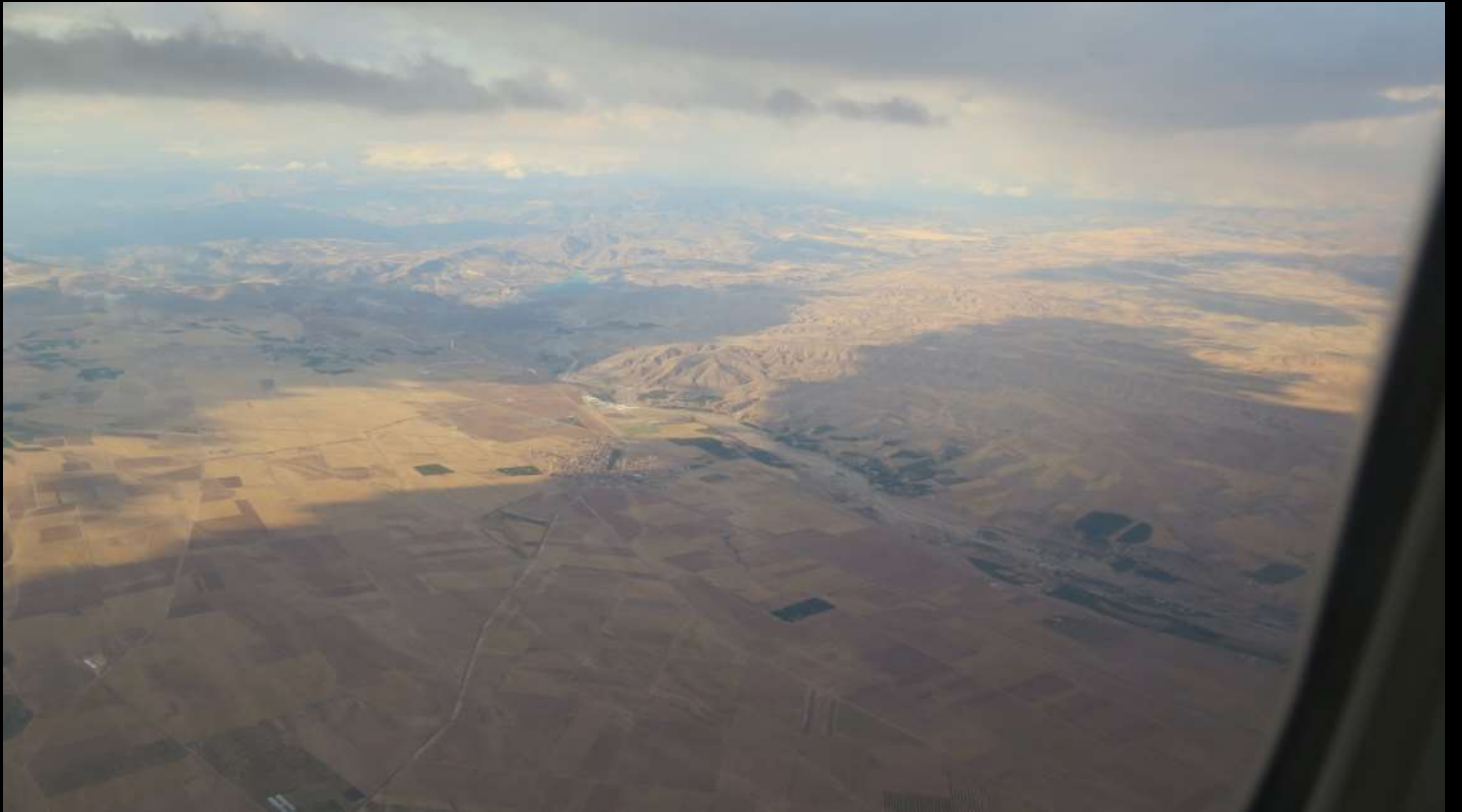
Sabiha Gökçen – Malatya uçuşu