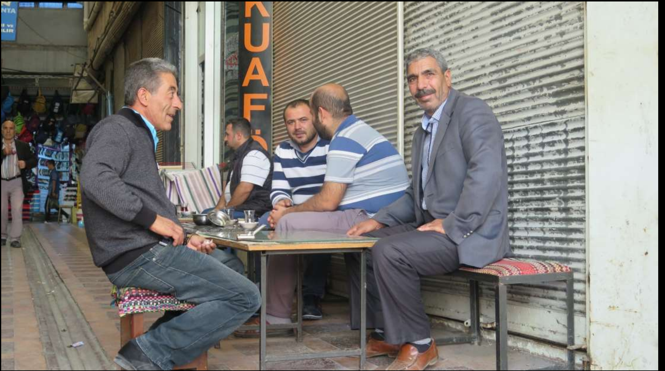
Karşılaştığımız her esnaf çay ikram etti...