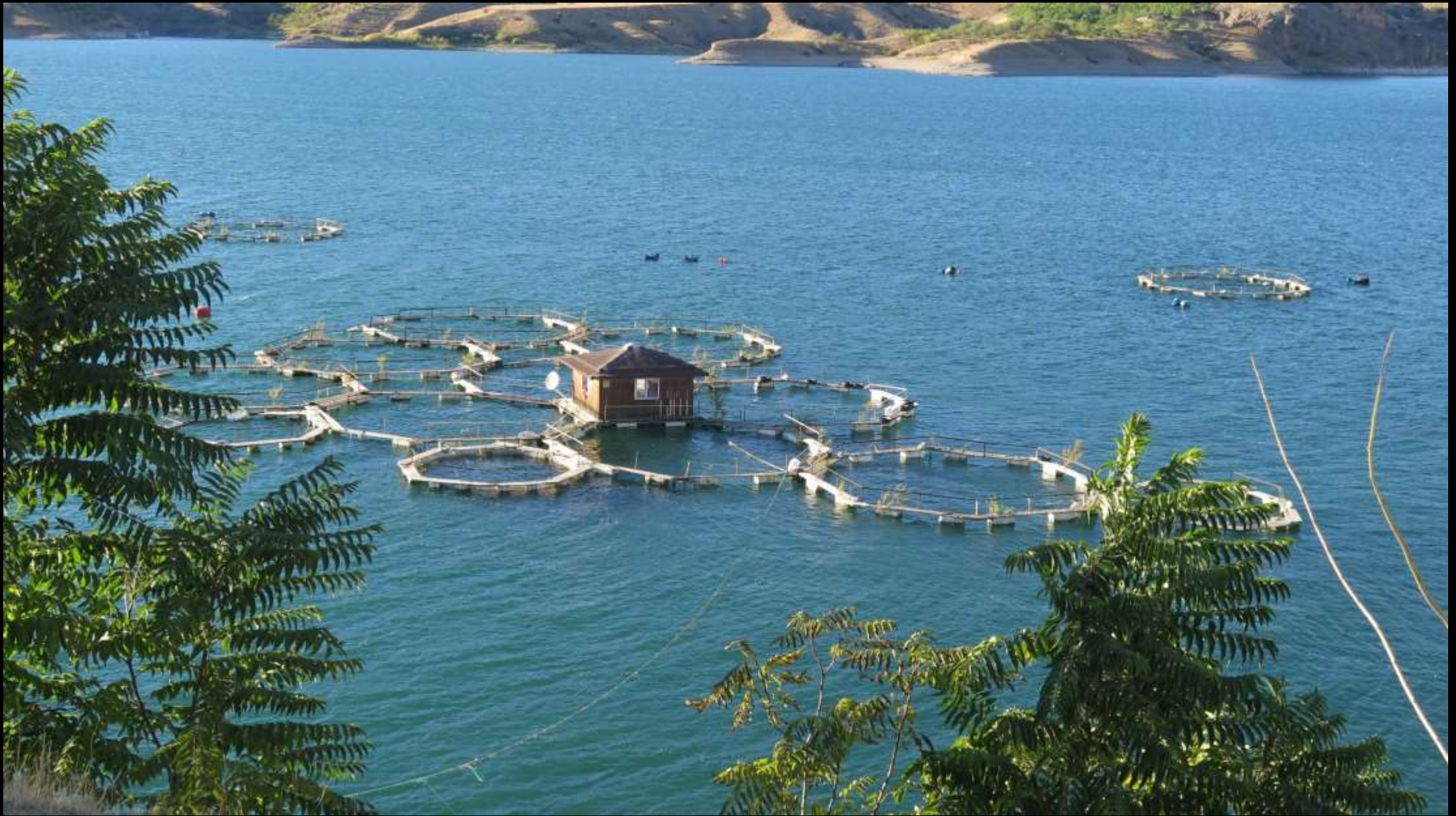
Karakaya barajında balık üretim çiftliđi...