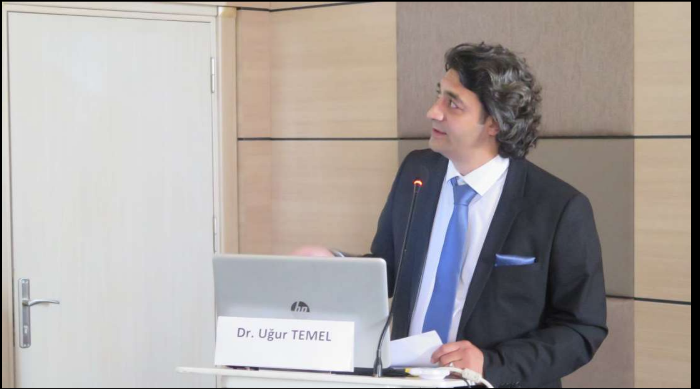
Sempozyum mutfağının baş aşçısı, beş yüz olguluk serisini sunuyor.