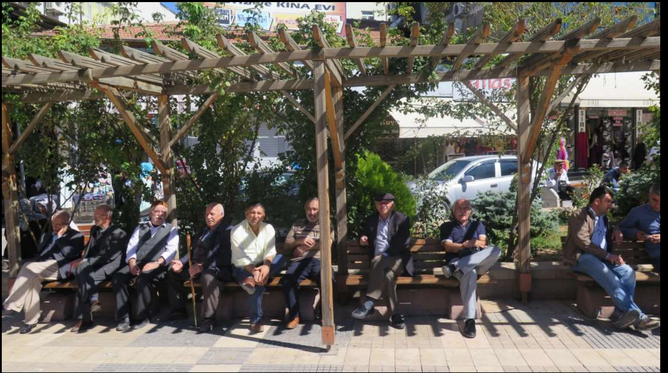
‘Emekliler Parkı’ «Şimdiden alışayım.»