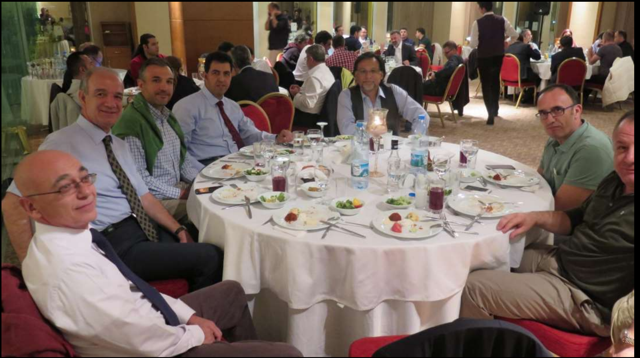
Sempozyum bitimi sonrası özlem gidermek için bahane akşam yemeđi.