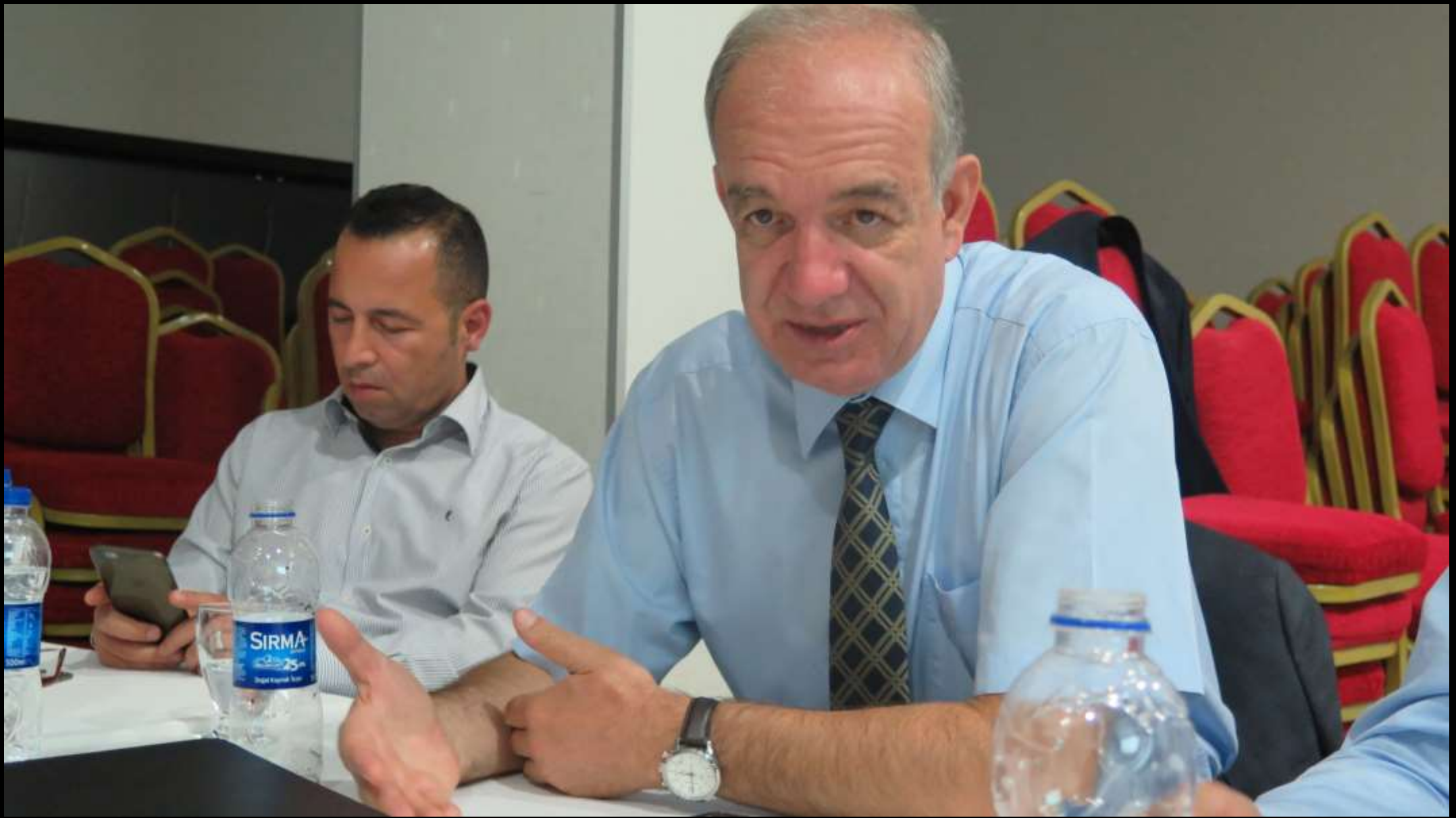
Dernek Başkanı tele konferansta... Toplantıya katılmayan üyelerin görüşlerini alıyor.