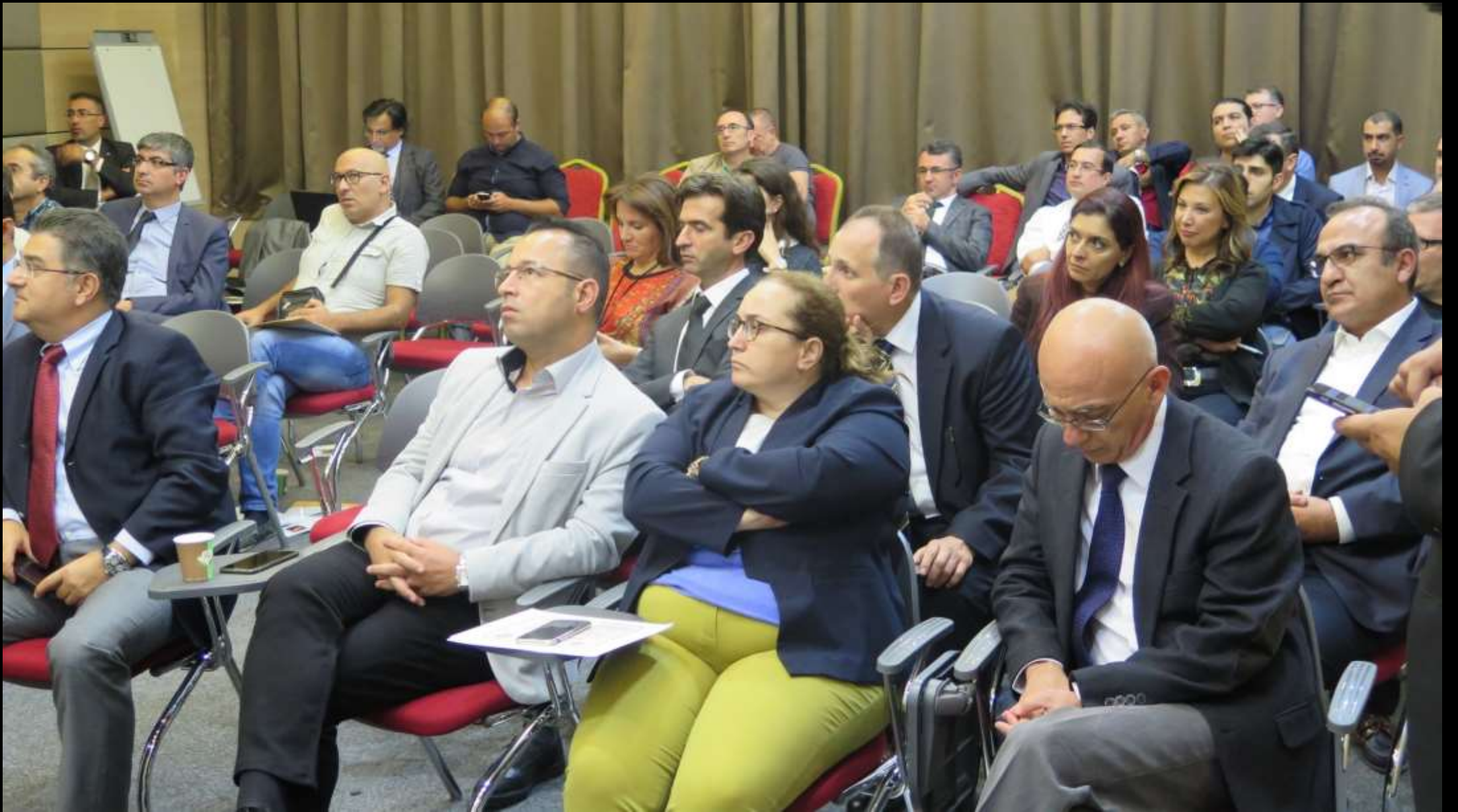
Dernek Başkanı, mesleki sorunları tartışmaya açınca herkes belleklerine not aldı.