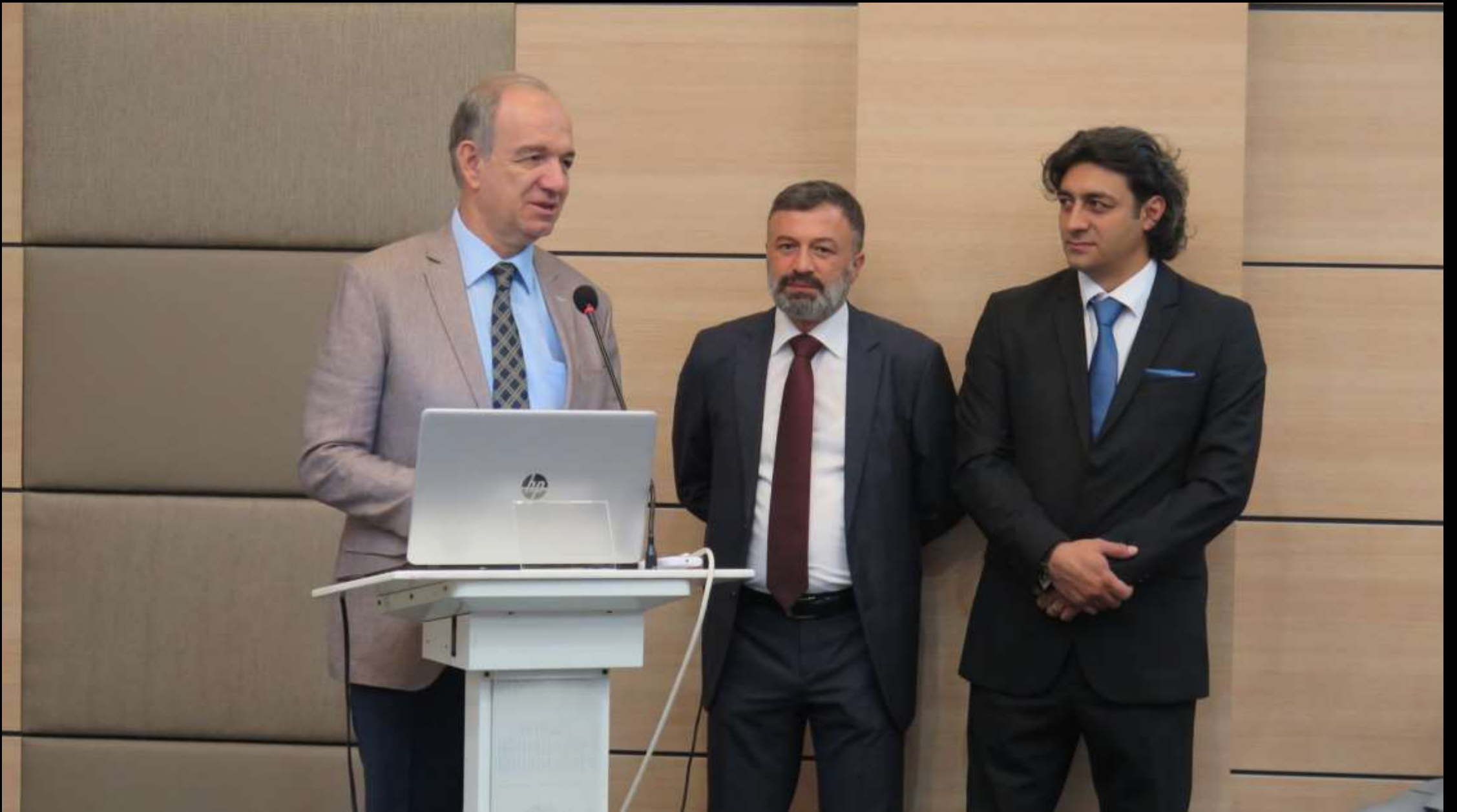
Başkan sempozyumun yükünü çekenlere «teşekkür» ediyor.