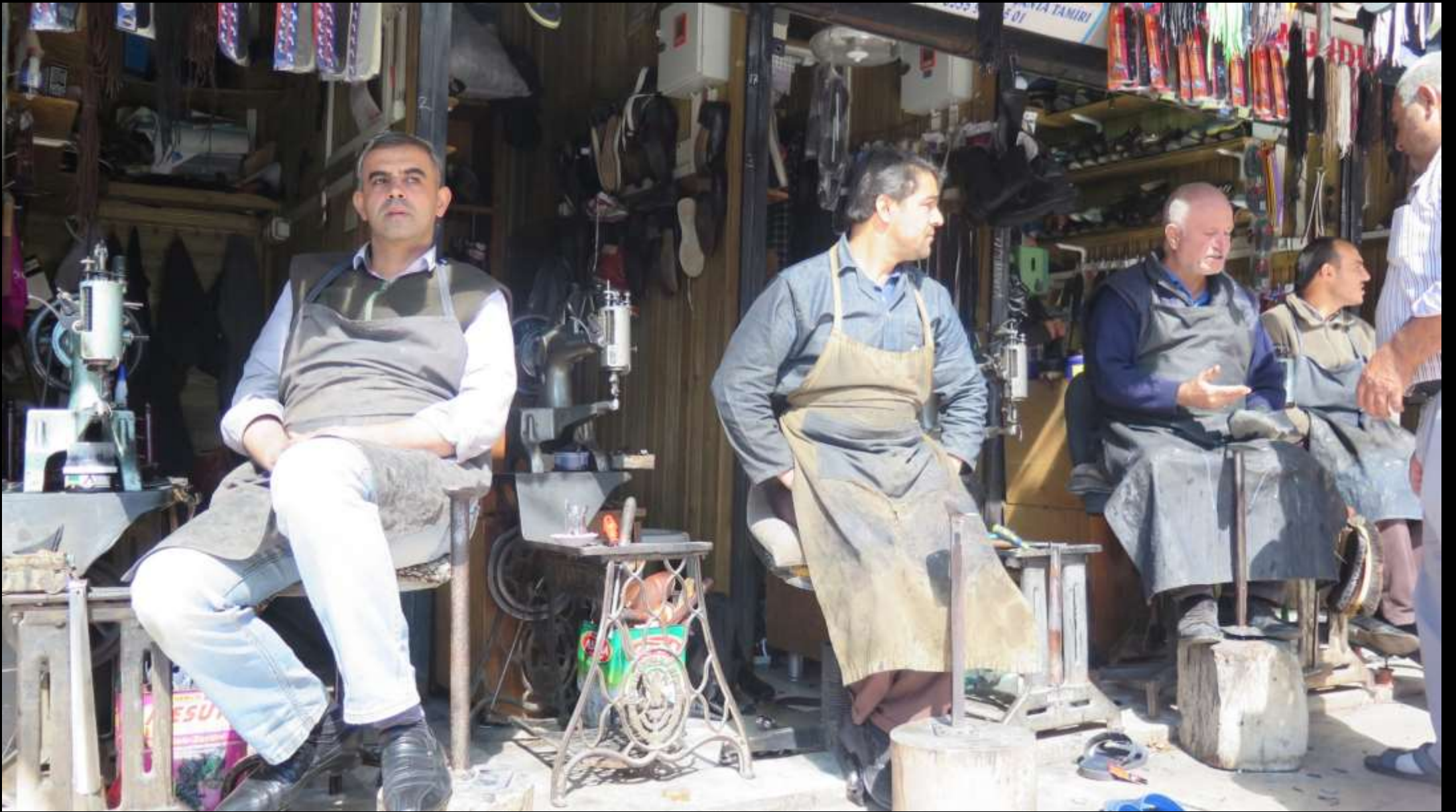
'Ayakkabı Tamirciler Sokağı'