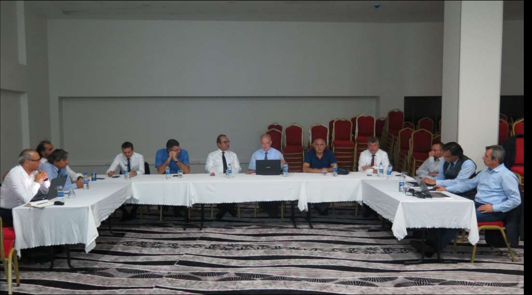
Sempozyum devam ederken TGCD YK ve 9. Ulusal Göğüs Cerrahisi Kongre Komitesi toplanma olanağı buldu..