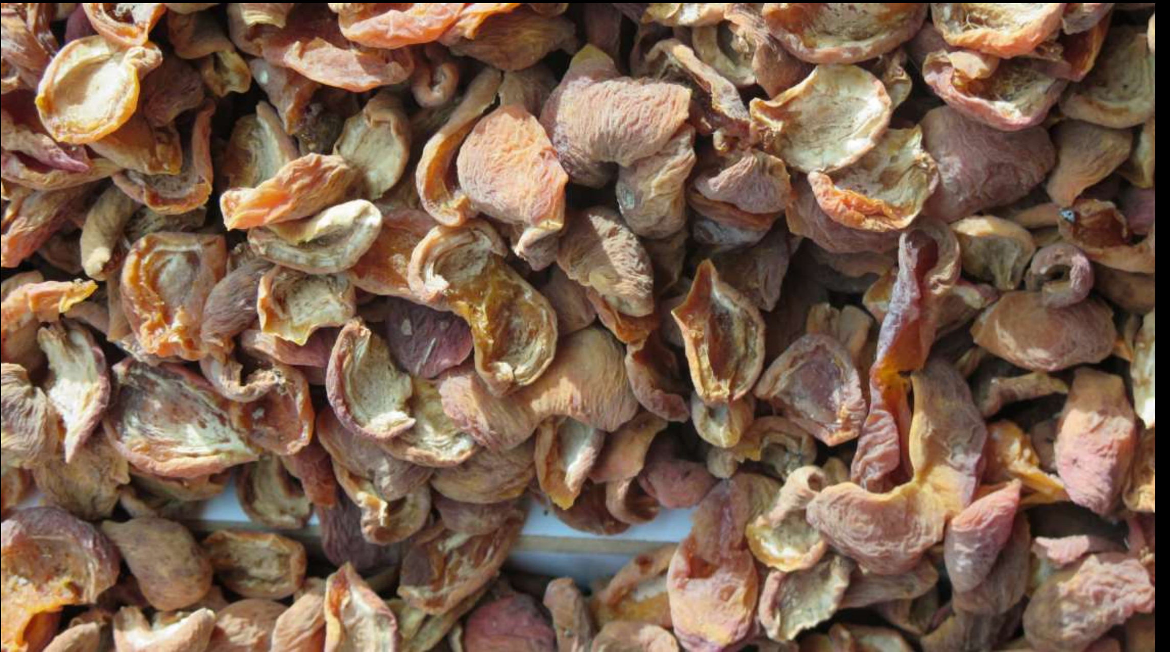
Hoşaflik Kayısı Kuru