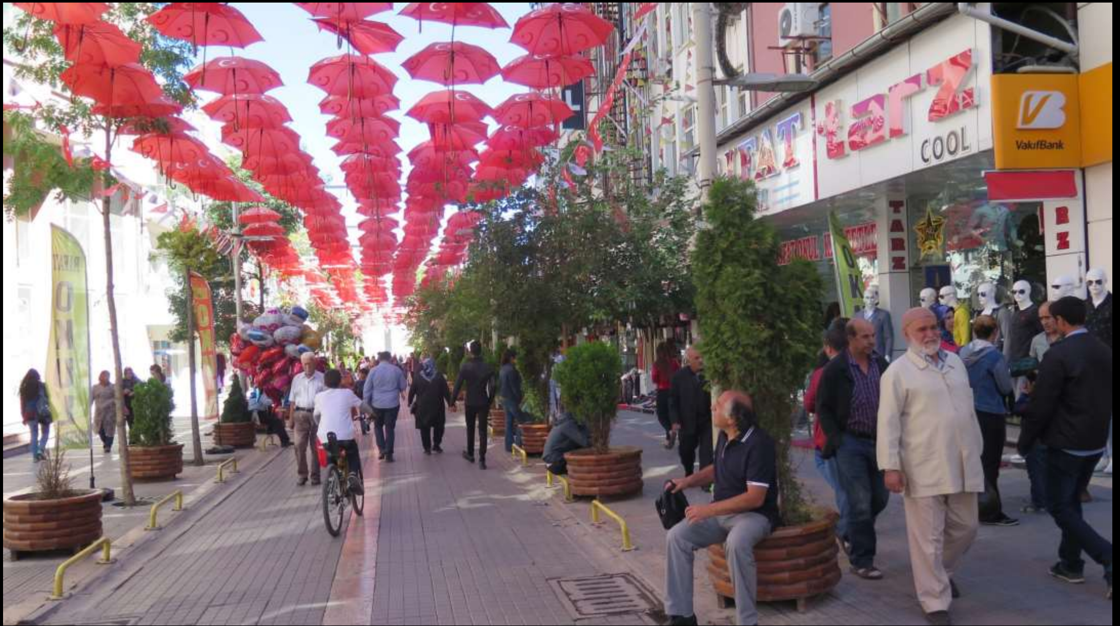
Rengarenk 'Şemsiye Sokağı' On beş Temmuz'dan sonra kırmızı – beyaza dönüşmüş.