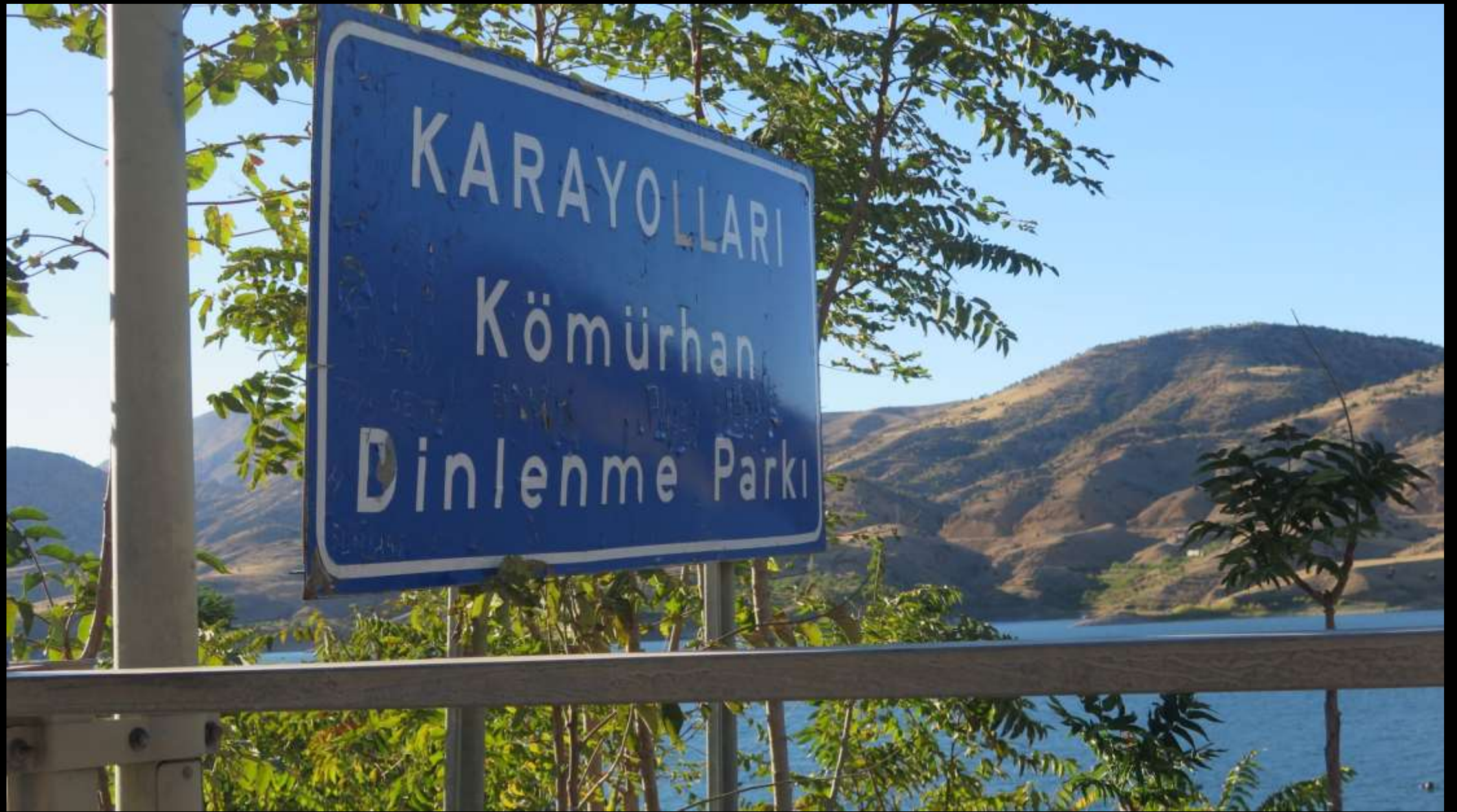
Malatya – Elazığ yolu  zerinde tarihi K m rhan k pr s ..