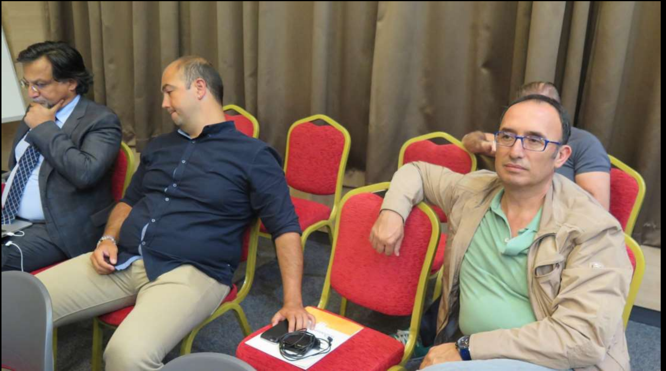
On saat süre ile yerinden kalkmadan izleyen bir katılımcı. Tanığım.