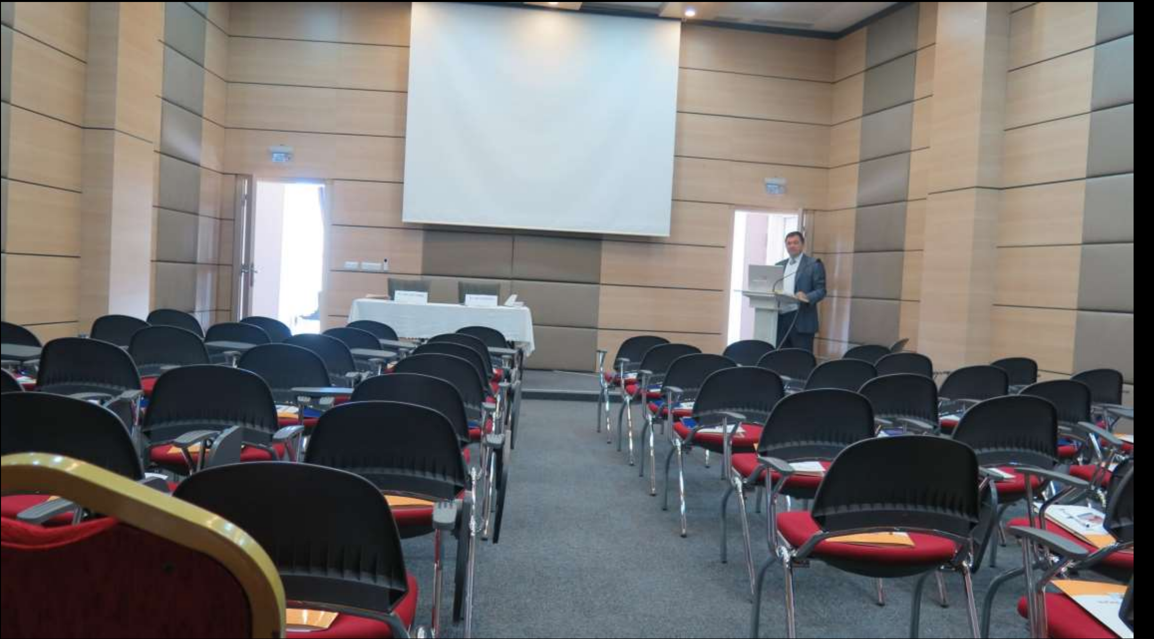
Sempozyum salonu tüm teknik alt yapıya sahiptir.