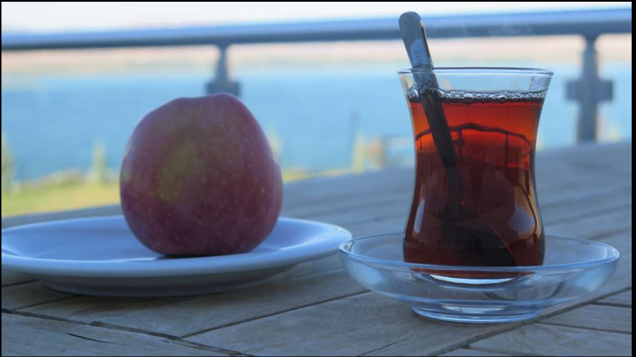
Çaylı 'natürmort' denemesi..