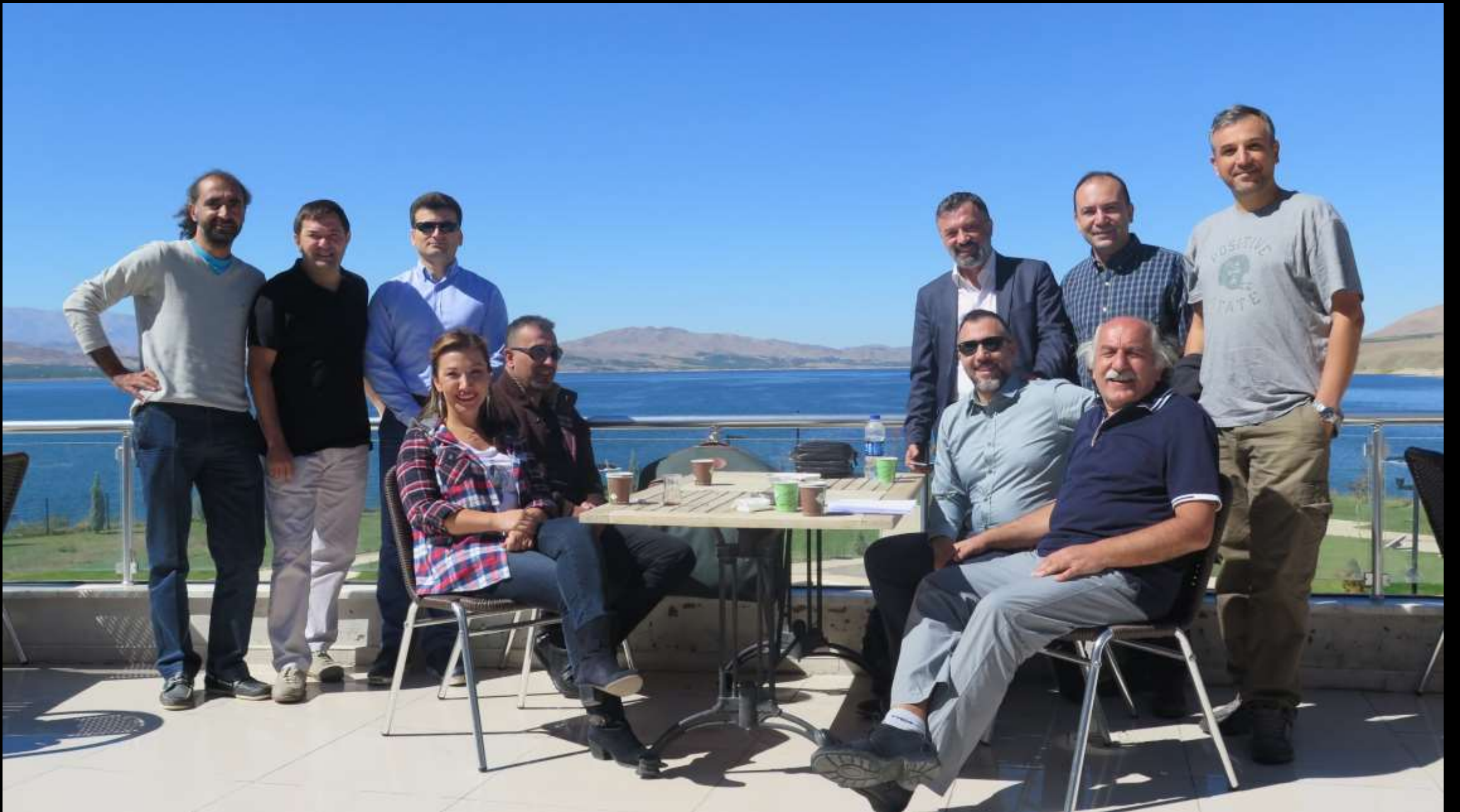
Kahvaltı sonu hatırası...