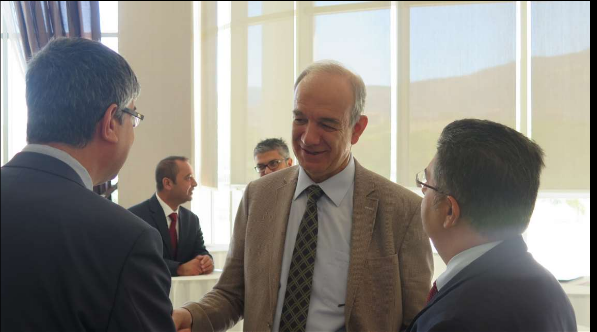
Sempozyum öncesi dostlarla özlem giderme...