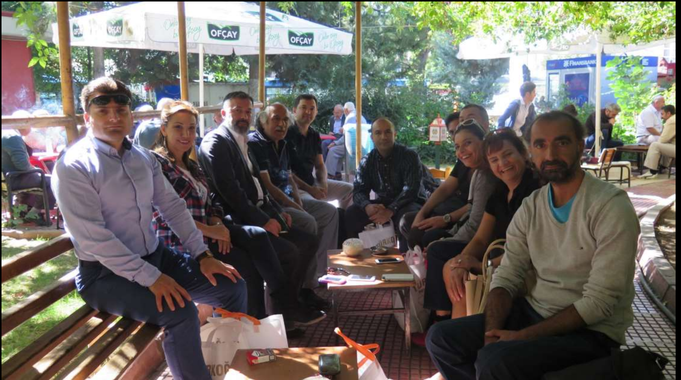
Emekliler ay Bahesinde mola...