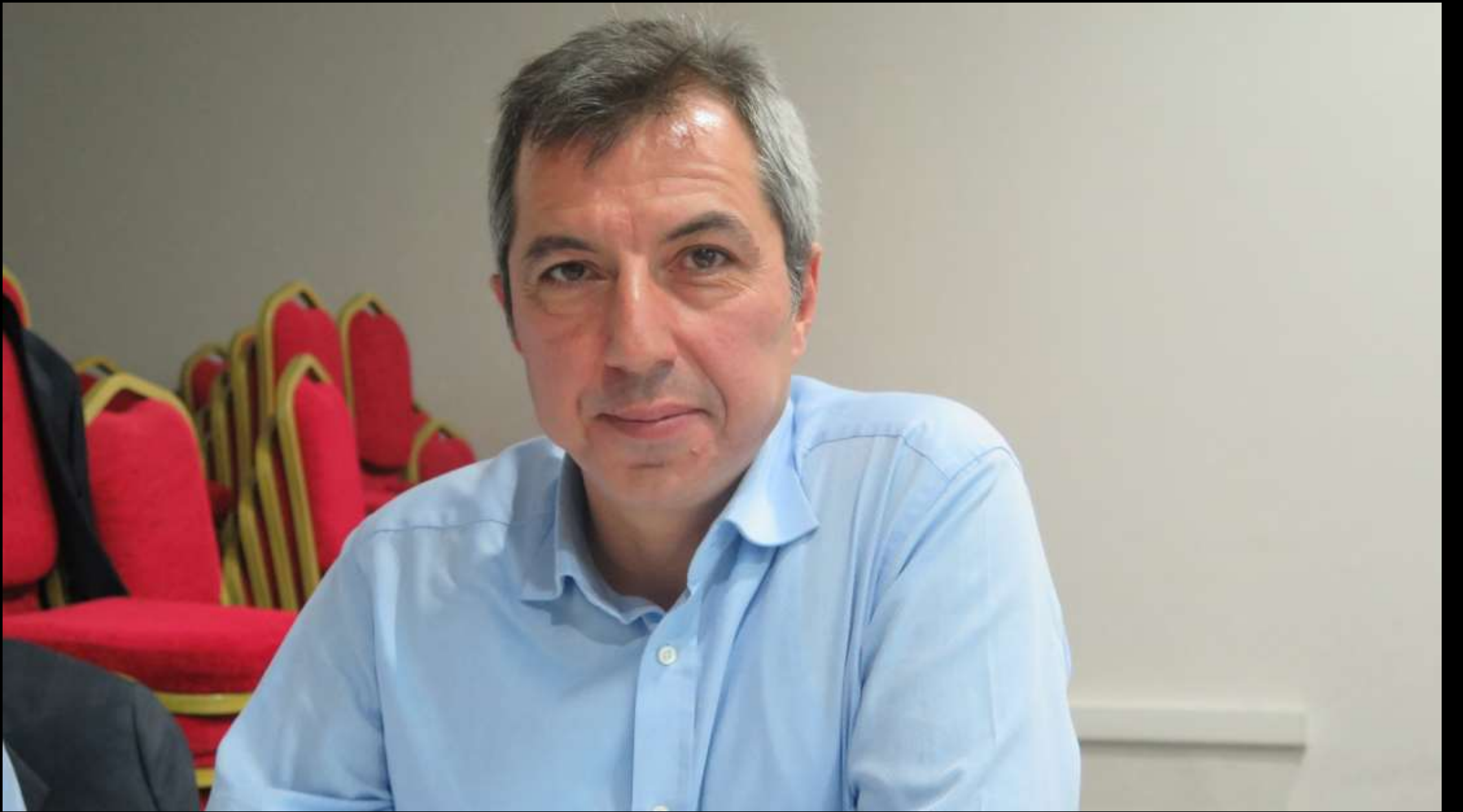
9. Ulusal Göğüs Cerrahisi Kongresi Başkanı. Dokuz aydır dokuz canlı gibi çalışıyor.