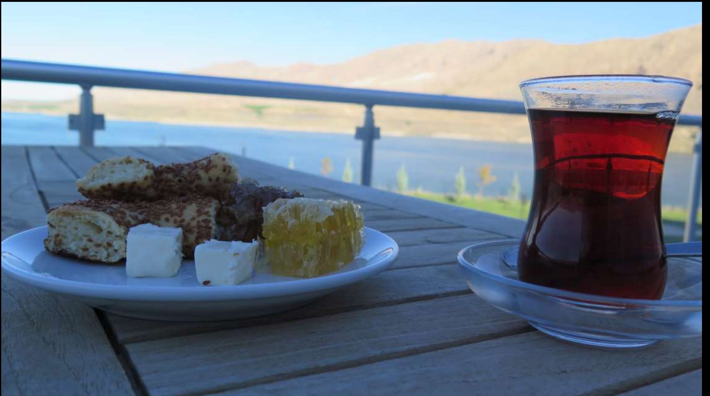
Bir kahvaltı denemesi...