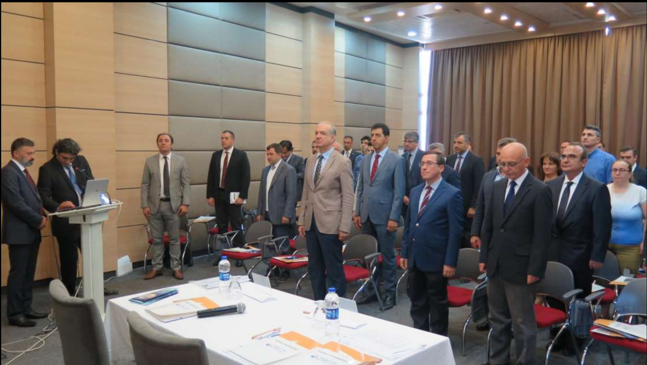
Saygı duruşu ve İstiklal Marşı seromonisi...