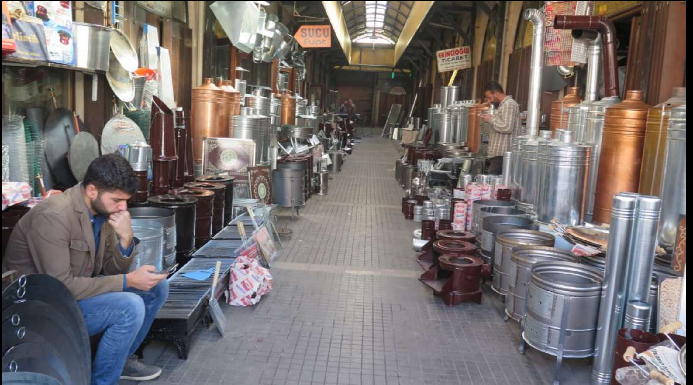
Bakırcılar Çarşısında bir sokak.