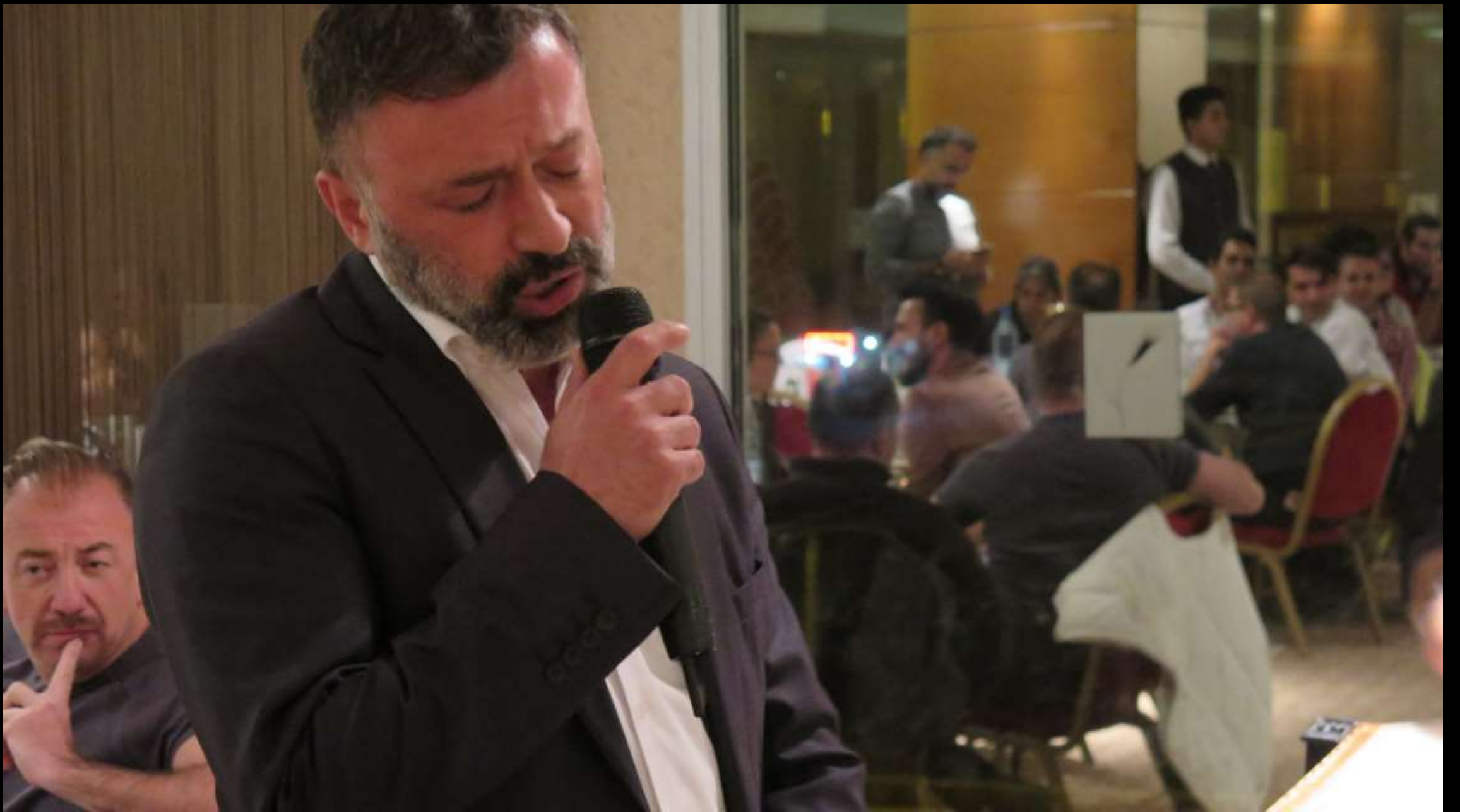
'Bir Malatya Klasığı'