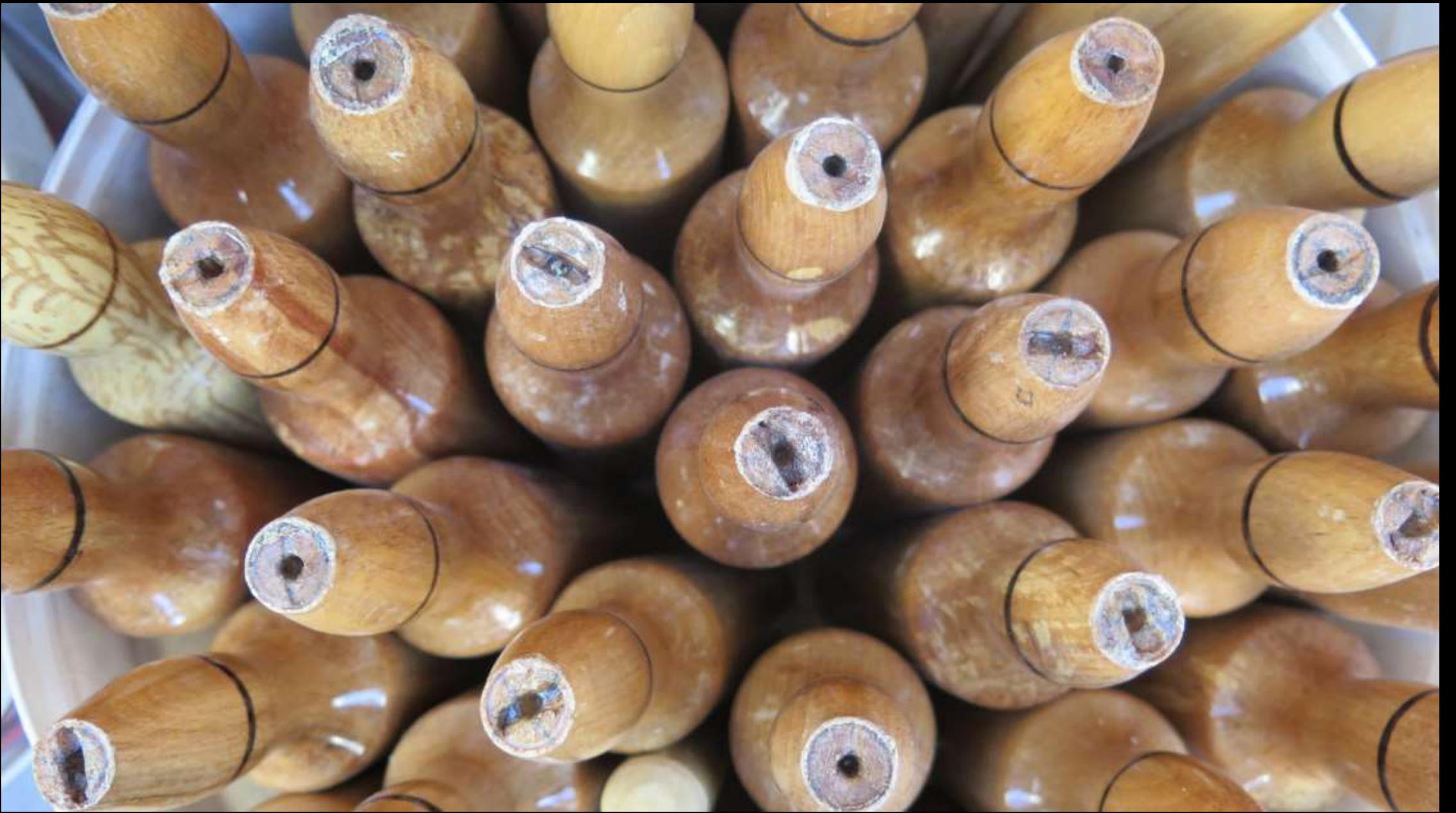
Bulmaca gibi bir görünü. Merdaneler.