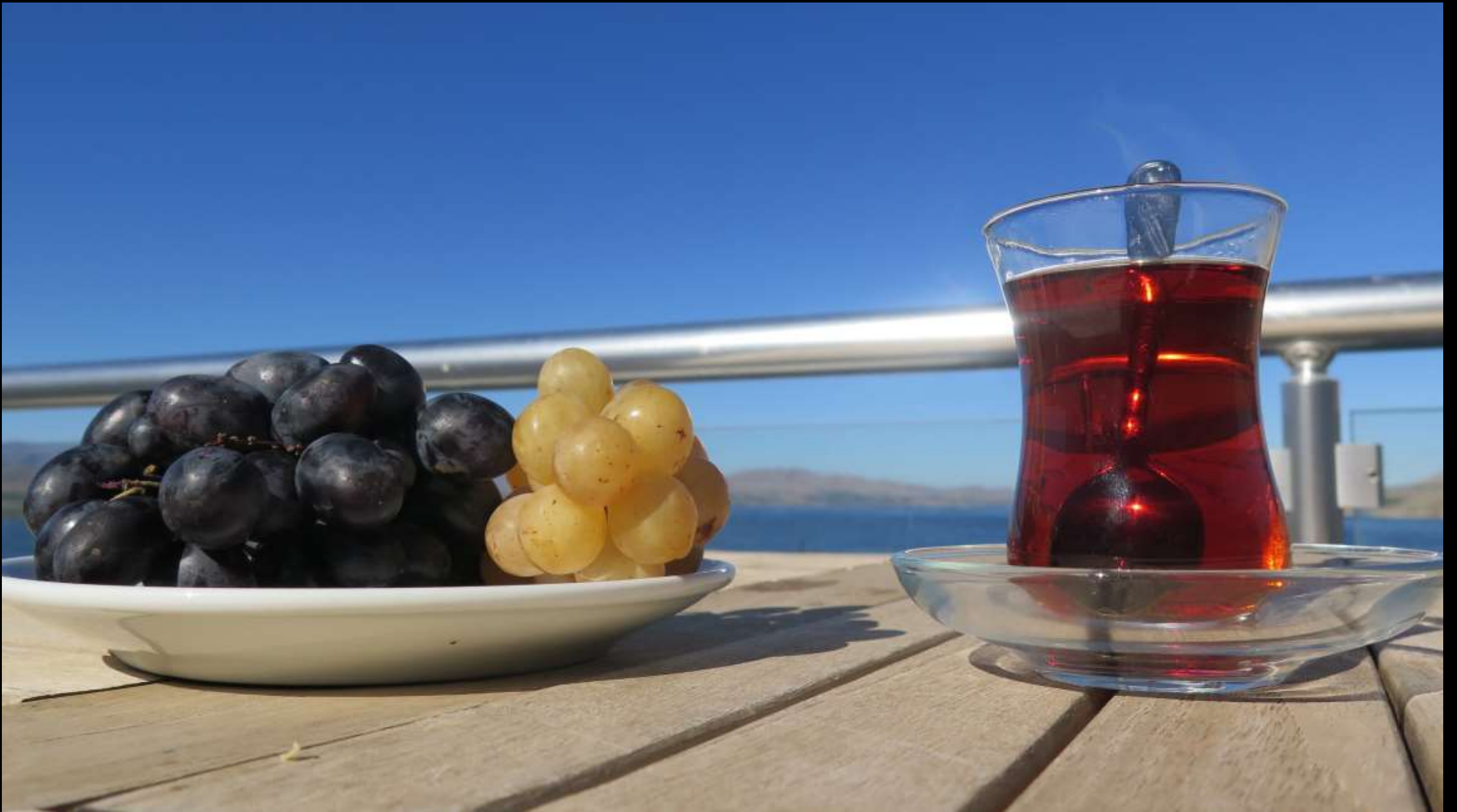
Öküzgözü ve ay