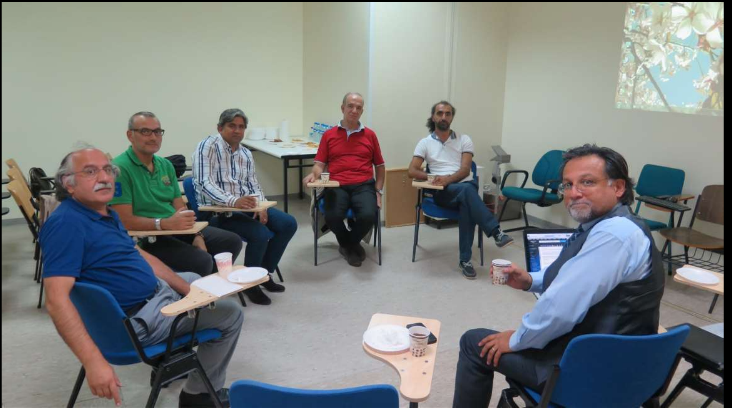
Gecenin bir yarısı TGCD YK ilk bulduđu salonda, mevcutlarla toplantıya başladı.