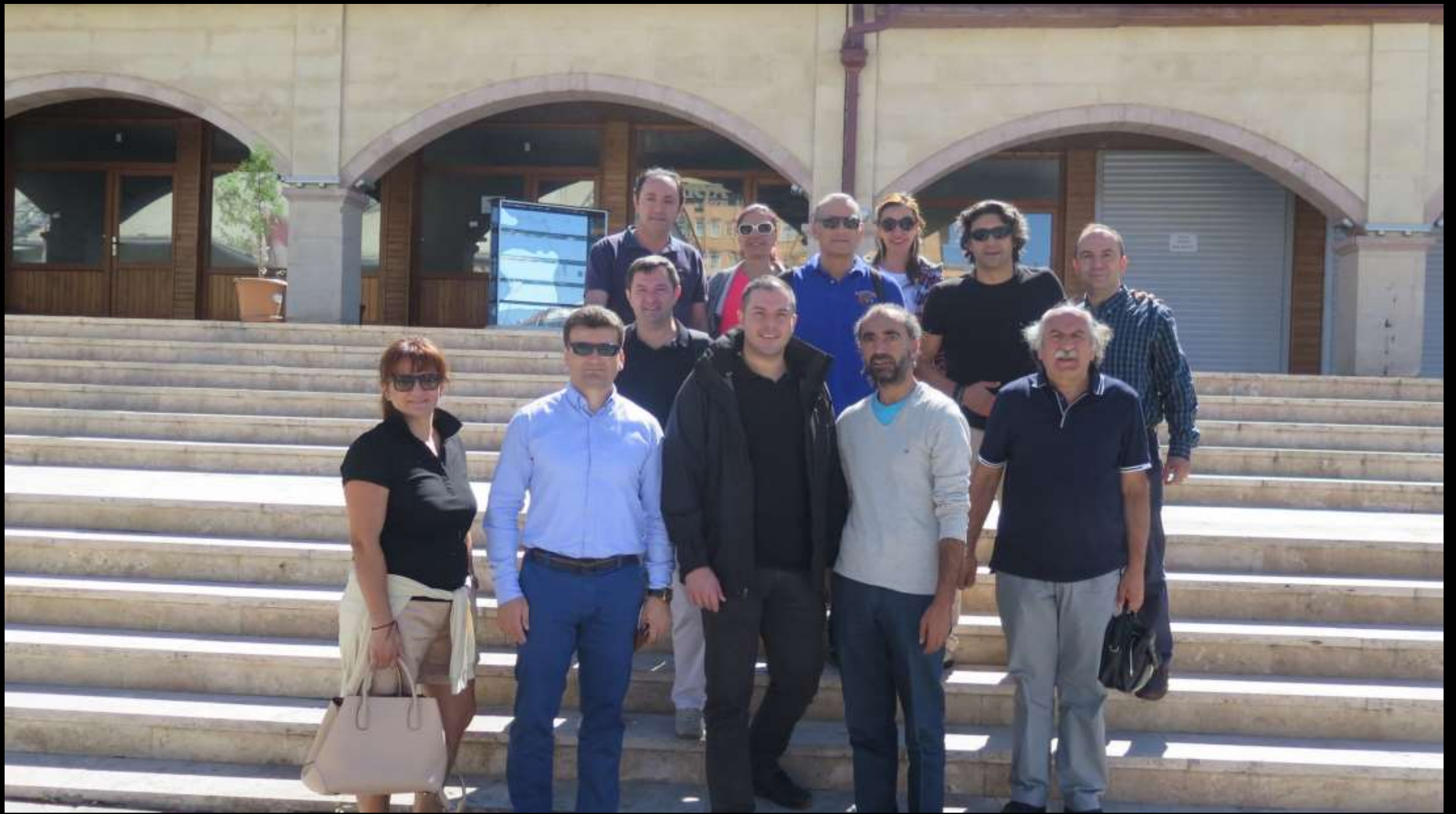
Yetmiş katılımcıdan arta kalanlar, 'Şira Hanı' önünde...