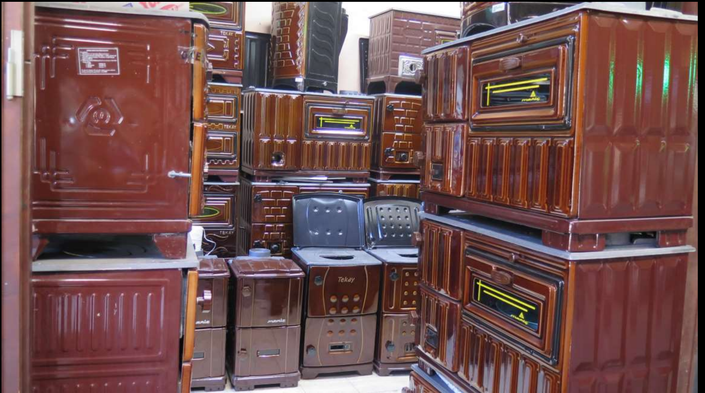
Modern Kuzine Sobalar